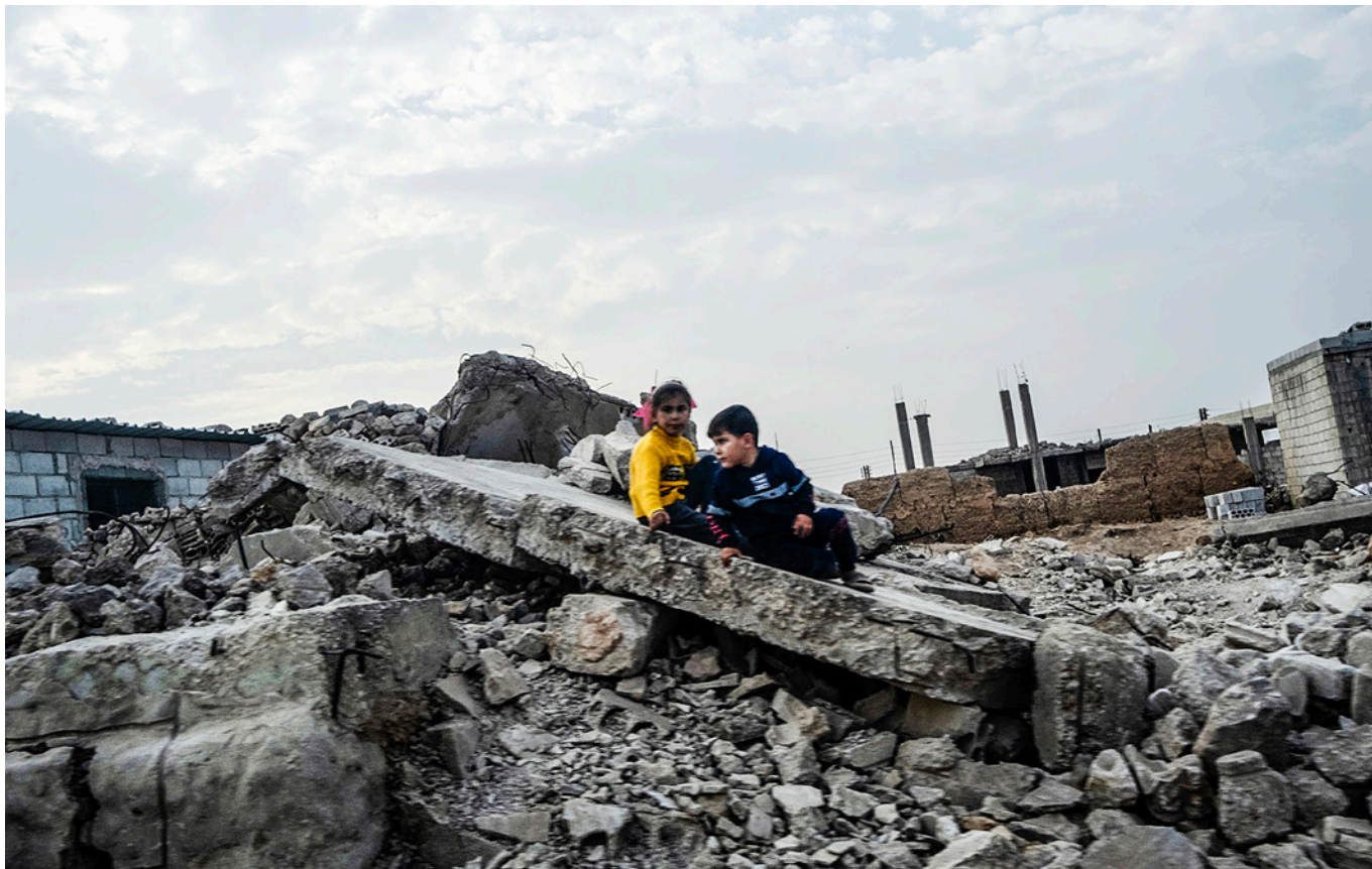
To børn leger i ruinerne nær Homs. De har ikke direkte forbindelse til Muhammed og hans historie.

For den nybagte far er det et tegn på en lys fremtid for Syrien.