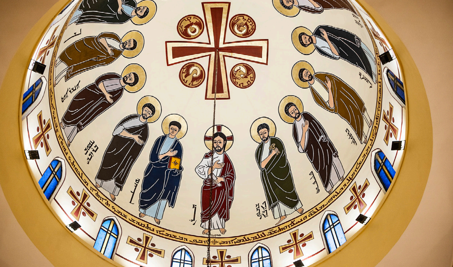
Kuppel i kirke i Syrien.