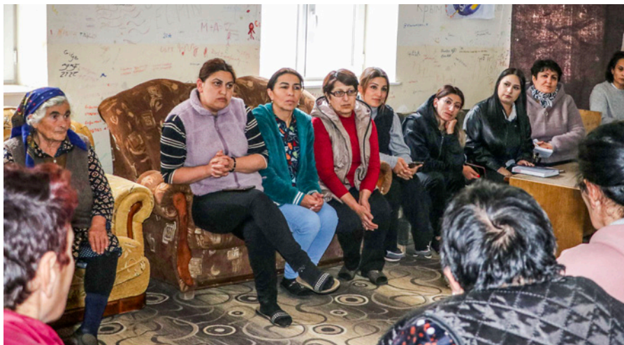
Community Development NGO samler af og til de flygtninge, som stadig bor i området, for at udveksle tanker og erfaringer.