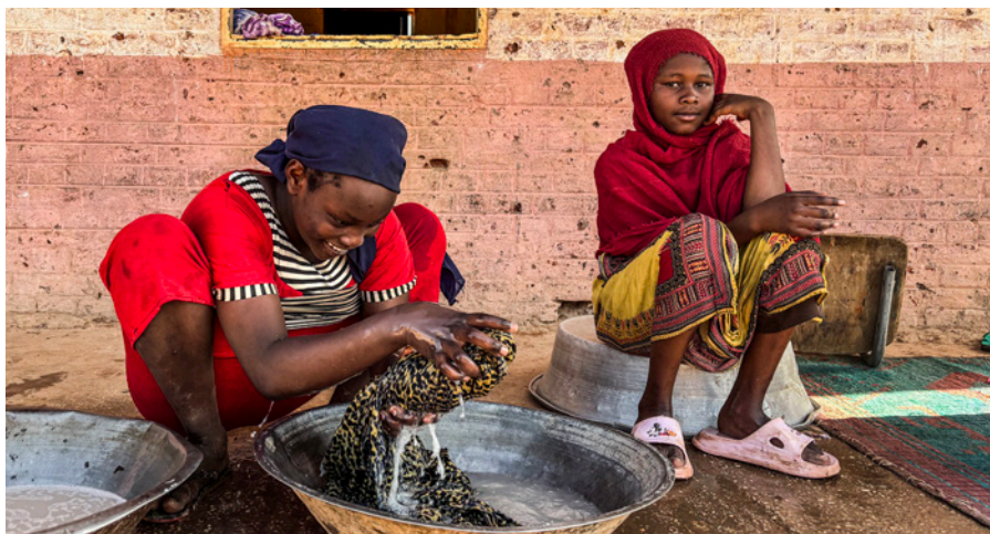
Vaskedag i Darfur med rent vand fra den vandpost, som Mission East og vores partner LM International har fået bygget i en landsby i Darfur.

I Sudan og nabolandet Tchad yder Mission East og vores partner, LM International, nødhjælp og anden støtte til de tusindvis af fordrevne. De er nogle af de mange skæbner i det, som FN kalder verdens største fordrivelseskriser. Men hvorfor er de flygtet, og hvad er udsigterne til at vende hjem igen?