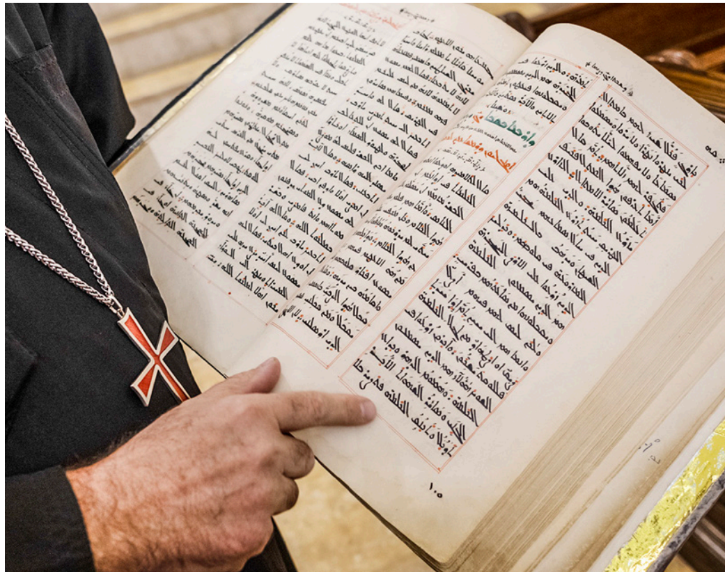
Bibelen på arabisk.

Rita fortæller, at hendes største bekymring i dag er frygten for, at der skal ske hendes unge datter noget. I takt med